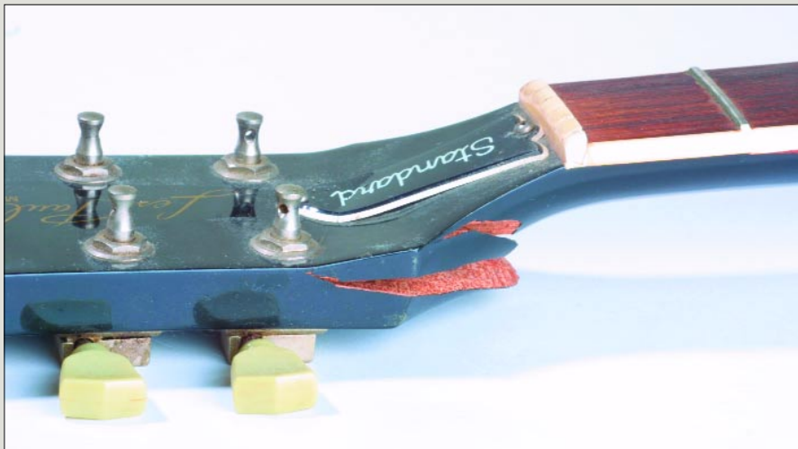
Abb.3 Glocke und Furnier halten die Kopfplatte noch zusammen

die stark von der Art des verwendeten Lacks abhängen. Originale Gibson-Gitarren sind mit – mehr oder weniger reinem – Nitrozellulose-Lack lackiert. Der hat den Vorteil gegenüber DD- oder Mehrkomponenten-Lack, dass er sich mit seinem Lösungsmittel Nitro nachträglich wieder anlösen lässt. Dadurch kann sich eine neue Schicht Nitrolack fest und ohne Übergänge mit dem alten Lack verbinden. Anschließend kann durch Nass-Schleifen und Polieren wieder eine einheitliche und glatte Oberfläche hergestellt werden. DD-Lack, der einmal angetrocknet ist, lässt sich allerdings nicht mehr chemisch lösen; dadurch sind Reparaturen im Lack weit schwieriger. Appetit kommt beim Essen, und durch diesen ersten Erfolg bin ich auf weitere Ideen für Verbesserungen an meiner Gitarre gekommen. Also habe ich mich für eine viel radikalere Lösung entschieden – der Lack soll komplett runter und die Gitarre neu lackiert werden. Aber das ist eine ganz andere Geschichte ... ■