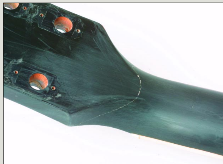
Abb.5 Die Nahtstelle muss nur noch optisch bearbeitet werden.

Nach dieser Geduldsprobe können wir die Klemmen entfernen und einen ersten Blick riskieren. Wenn alles so aussieht wie in Abb. 5 – herzlichen Glückwunsch! Rein funktional ist die Gitarre wieder fit. Leute mit guten Nerven können mal mit der Hand einen ersten Bruchtest machen: einfach versuchen, die Kopfplatte sanft nach vorne zu biegen! Wenn die Leimung ordentlich gemacht wurde, passiert wirklich nichts mehr. Was jetzt noch stört, ist natürlich die Optik – der Riss im Lack ist selbstverständlich deutlich zu erkennen und auch zu erfühlen. Doch auch das lässt sich klären, jedoch auf verschiedene Arten und Weisen,